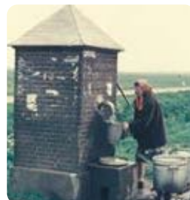
Een inwoner van Bruchem haalt water voor de was uit de dorpspomp, april 1957.