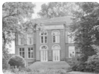
Landgoed Groenhoven, 1966.