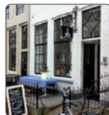
Bommels Bakhuis Gamersche- straat 55