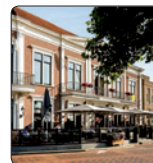
De Verdraag- zaamheid Waalkade 6