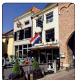
Pannenkoeken- huis Waterstraat 35