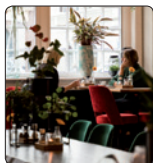
In de Roos Markt 10