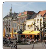
't Stadscafé Markt 4-6