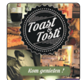
Toast&Tosti Boschstraat 38