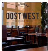
Foodbar OostWest Nieuwstraat 4